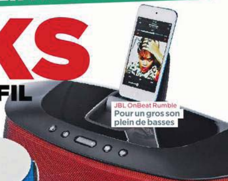
JBL OnBeat Rumble Pour un gros son plein de basses

Grâce au Bluetooth, vivez la musique en liberté !