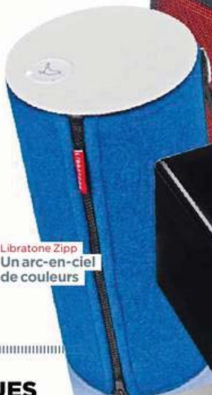
Libratone Zipp Un arc-en-ciel de couleurs