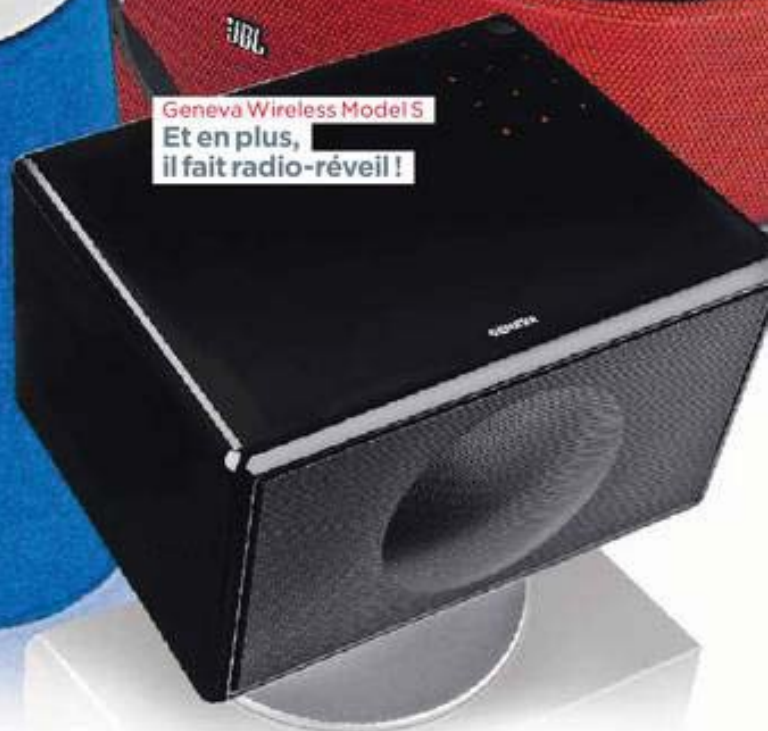
Geneva Wireless Model S Et en plus, il fait radio-réveil !